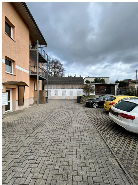
Hof, Abstellräume und Werkstatt