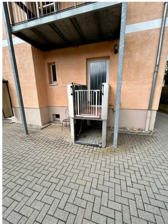
Barrierefreier Zugang zum EG r.