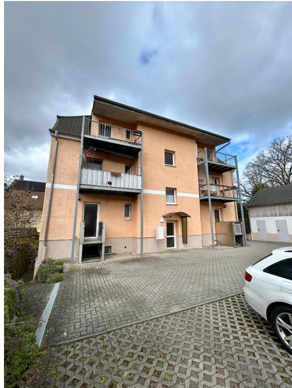
Barrierefreier Zugang zum EG I.